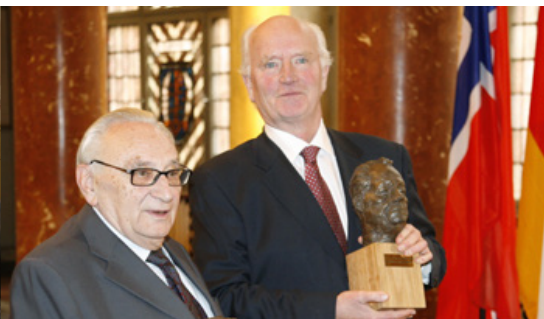
Et styremøte i 2024 (til venstre). Thorvald Stoltenberg og Egon Bahr var initiativtakerne til stiftelsen. Vennskapet deres strakte seg tilbake til 1960-tallet, da deres felles venn Willy Brandt førte dem sammen. I 2007 fikk de Willy Brandt-prisen for sitt mangeårige engasjement for de norsk-tyske forbindelsene.

Eine Vorstandssitzung 2024 (Foto links). Die beiden ehemaligen Minister Egon Bahr und Thorvald Stoltenberg waren die Initiatoren der Stiftung. Sie waren seit den 1960er Jahren eng befreundet. Kennengelernt haben sie sich durch ihren gemeinsamen Freund Willy Brandt. 2007 wurden sie für ihr Engagement für die bilateralen Beziehungen mit dem Willy-Brandt-Preis geehrt.